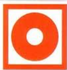
1 BGV A8 F08 DIN 4844-2 D-F008 ASR A1.3 F008