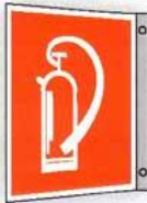
1 Fahnschild Feuerlöscher

1 BGV A8 F05 DIN 4844-2 D-F005 ASR A1.3 F005