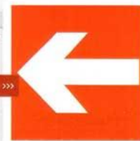
1 BGV A8 F02, DIN 4844-2 D-F001, ASR A1.3 F001