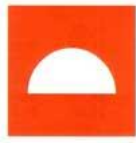
1 BGV A8 F07 DIN 4844-2 D-F007 ASR A1.3 F007