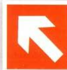
1 BGV A8 F02 DIN 4844-2 D-F002 ASR A1.3 F002