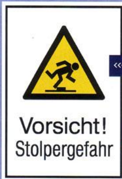
1 Vorsicht! Stolpergefahr