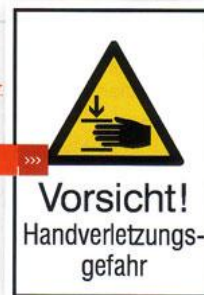
5 Vorsicht! Handverletzungsgefahr