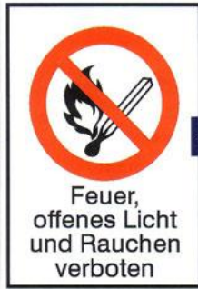
1 Verbots-Kombischild Feuer, offenes Licht und Rauchen verboten